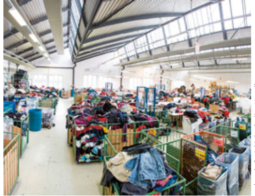
carla - ein Projekt der Caritas Vorarlberg

Eine Arbeitsstelle hilft, die Lebensverhältnisse zu stabilisieren, und zwar wirtschaftlich, sozial und gesundheitslich.