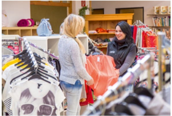
Caritas Vorarlberg / ©Weissengruber Fotografie